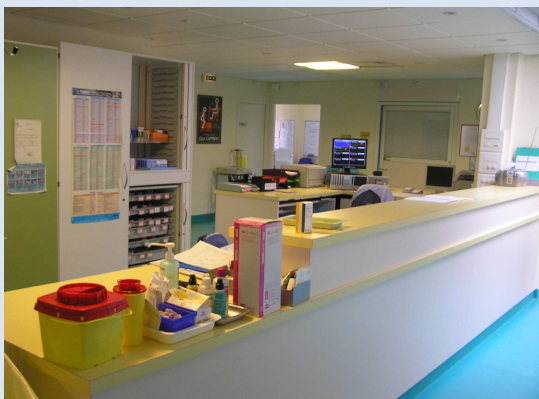
Salle de soins