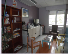
Salle des familles