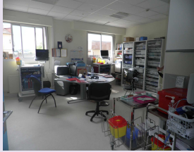
Salle de soins